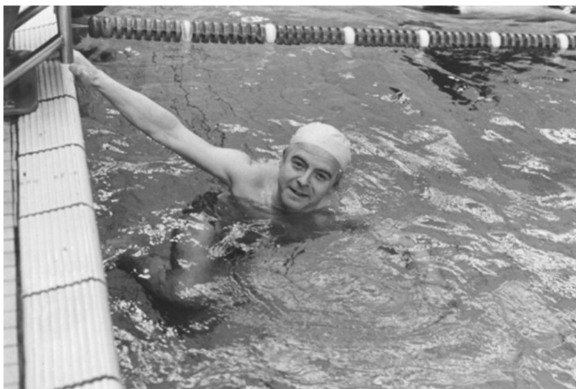
1984 Der leidenschaftliche Hobbyschwimmer.