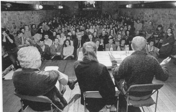
März 1989: Mit Hans Magnus Enzensberger während der Leipziger Buchmesse auf dem Podium der Großen Veranstaltungstonne in der Moritzbastei.