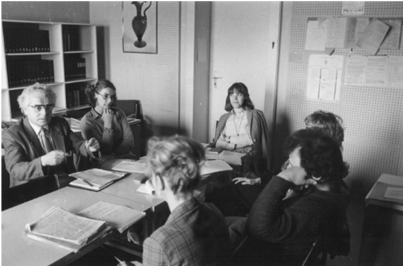
1984 Als Direktor der Sektion Germanistik und Literaturwissenschaft im Amtszimmer im Universitätshochhaus.