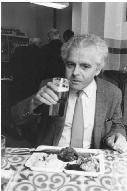
1984 Nach getaner Arbeit ist gut ruhen, in der Mensa des Instituts für Literatur »Johannes R. Becher«.