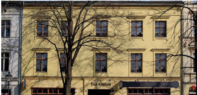
Geschäftsstelle Potsdam, Dortustraße 53.